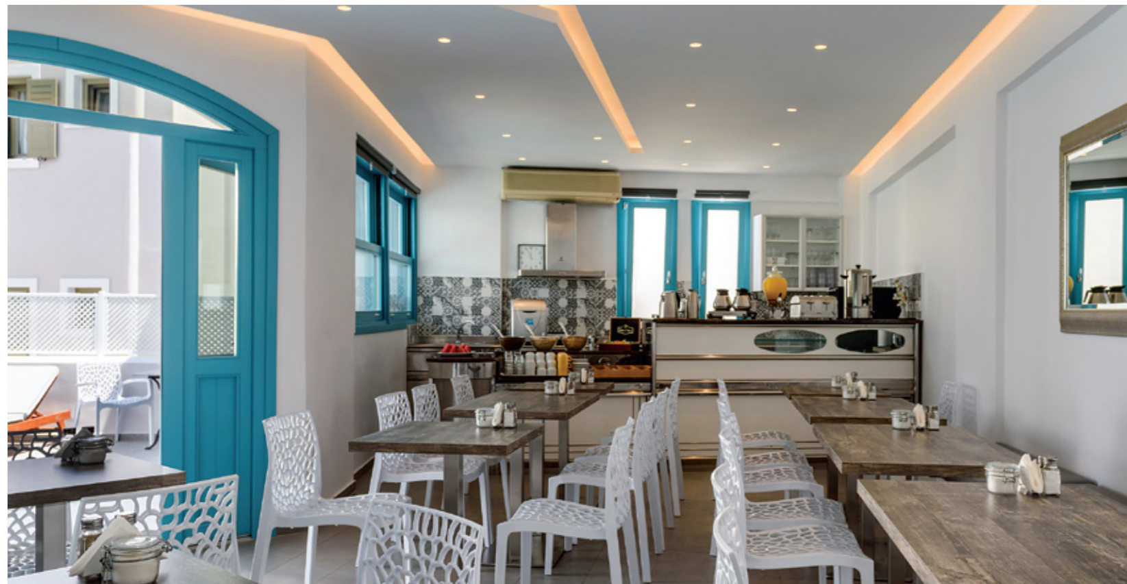
NIKOLAS HOTEL SANTORINI, Καρτεράδος, Σαντορίνη