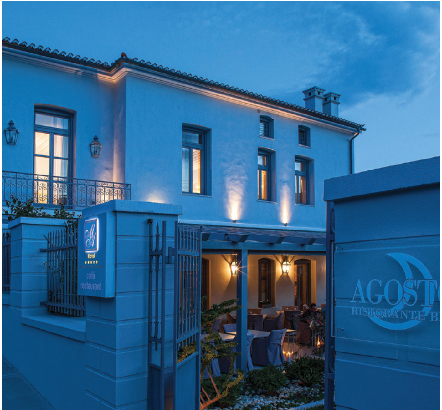
MICRA AGGLIA BOUTIQUE HOTEL & SPA, Χώρα Άνδρου

Φωτογραφία Εξωφύλλου: KALOS IMAR HOTEL, Μεσσαριά, Σαντορίνη