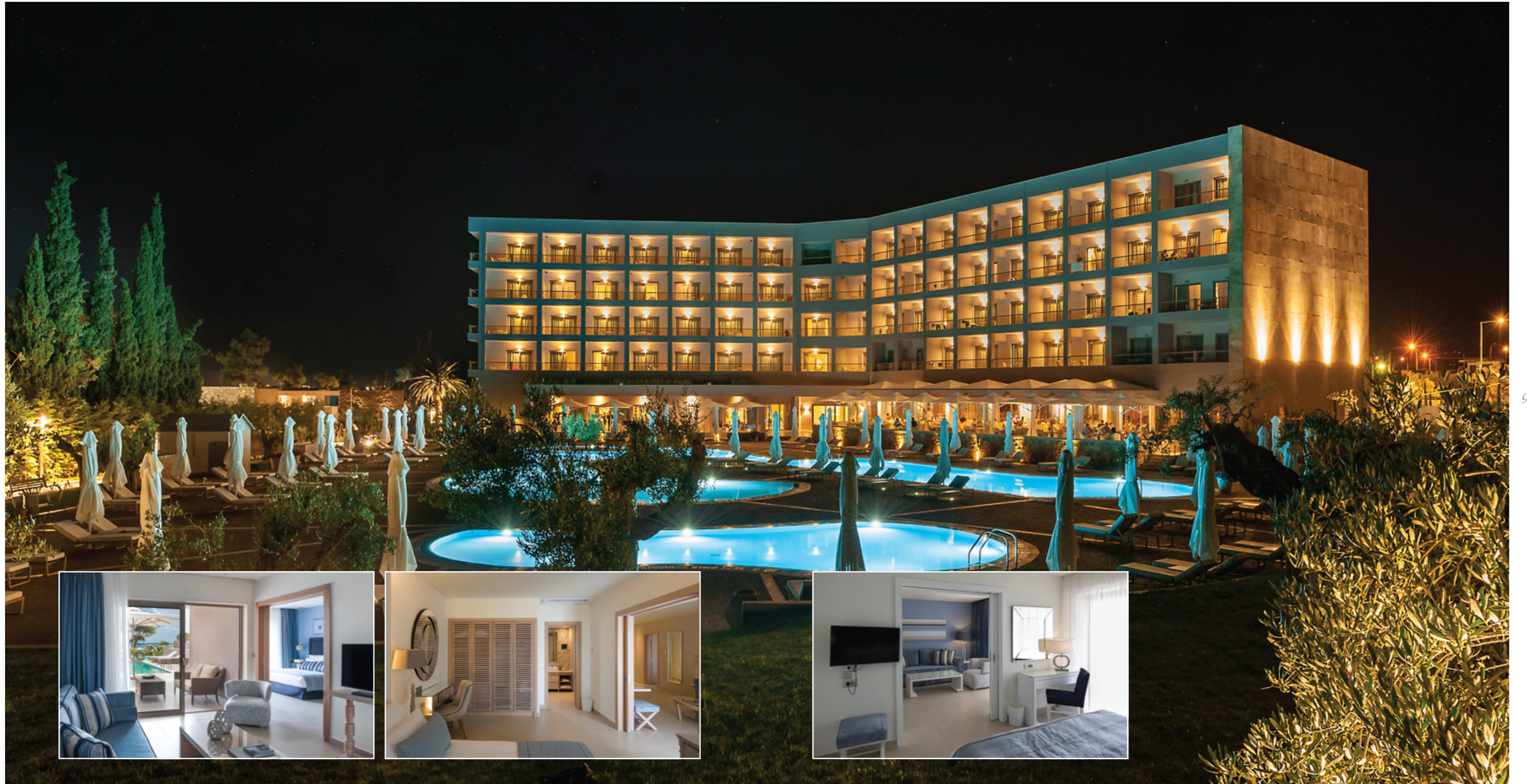
IKOS OLIVA, Γερακινή, Χαλκιδική