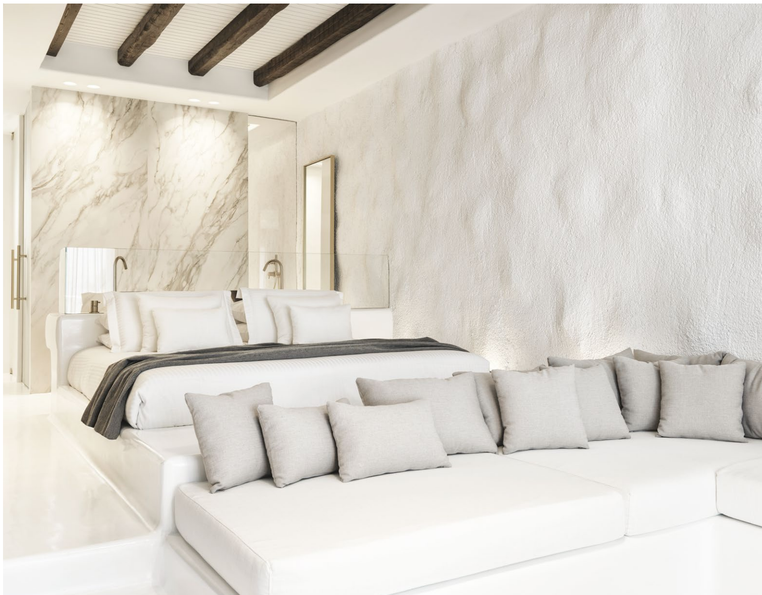
ΤΑ ΠΑΡΑΔΟΣΙΑΚΑ ΚΤΙΣΤΑ ΣΤΟΙΧΕΙΑ ΤΩΝ ΕΣΩΤΕΡΙΚΩΝ ΧΩΡΩΝ ΣΤΗΝ ΚΥΚΛΑΔΙΚΗ ΑΡΧΙΤΕΚΤΟΝΙΚΗ ΑΠΟΤΕΛΕΣΑΝ ΤΗΝ ΚΕΝΤΡΙΚΗ ΙΔΕΑ ΓΙΑ ΤΗ ΔΙΑΜΟΡΦΩΣΗ ΤΗΣ ΔΕΥΤΕΡΗΣ ΤΥΠΟΛΟΓΙΑΣ ΤΩΝ ΔΩΜΑΤΙΩΝ.