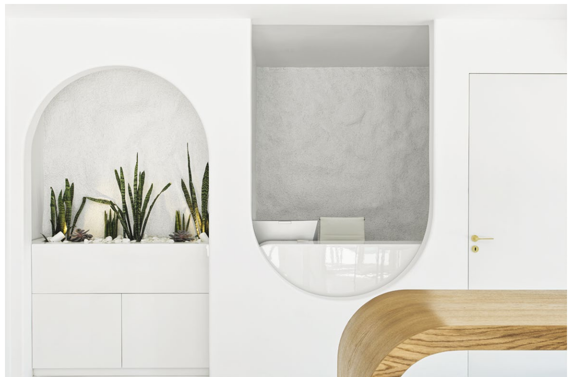
Η ΑΝΤΙΘΕΣΗ ΛΕΙΩΝ ΚΑΙ ΑΔΡΩΝ ΕΠΙΦΑΝΕΙΩΝ ΑΝΑΔΕΙΚΝΥΕΙ ΤΑ ΓΕΩΜΕΤΡΙΚΑ ΣΤΟΙΧΕΙΑ ΣΤΟ ΧΩΡΟ ΤΗΣ ΥΠΟΔΟΧΗΣ.