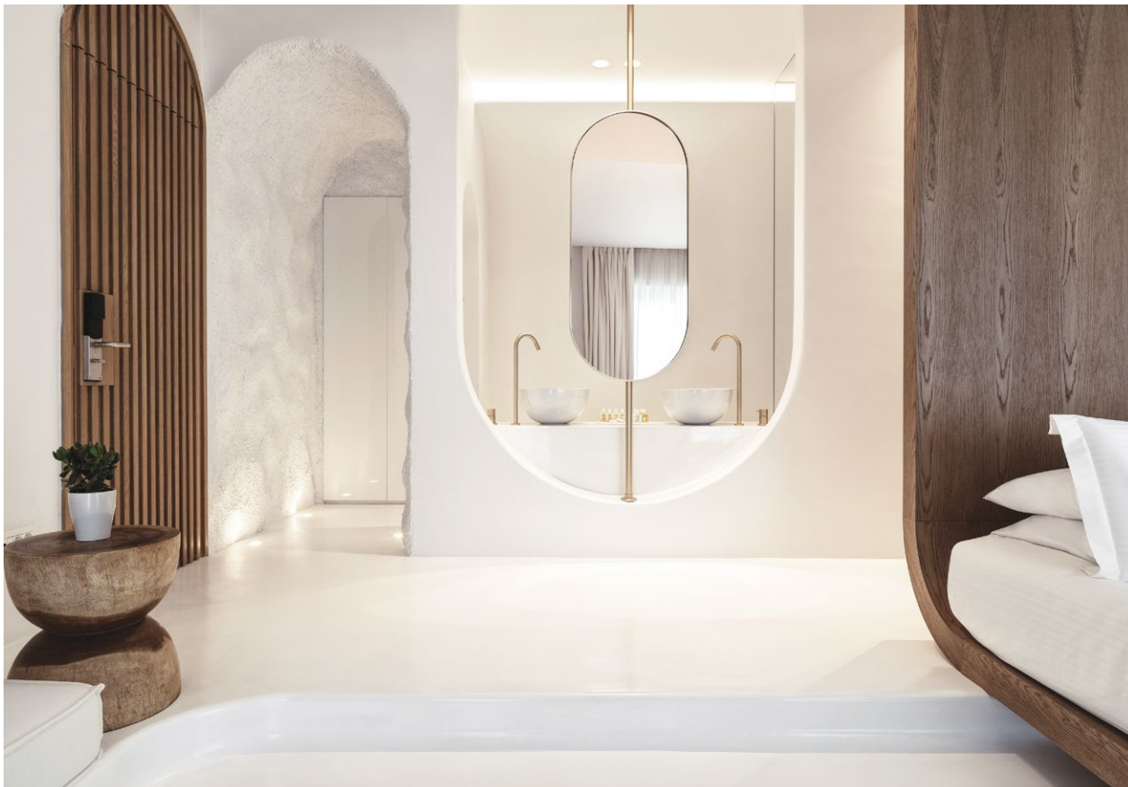
ΣΤΑ ΔΩΜΑΤΙΑ ΤΟΥ "ΜΥΚΟΝΟΣ EARTH SUITES", Η ΓΕΩΜΕΤΡΙΑ ΤΗΣ ΑΨΙΔΑΣ ΕΦΑΡΜΟΖΕΤΑΙ ΩΣ ΑΝΟΙΓΜΑ, ΣΤΟΙΧΕΙΟ ΤΗΣ ΔΙΑΚΟΣΜΗΣΗΣ ΑΛΛΑ ΚΑΙ ΧΩΡΟΣ ΜΕΤΑΒΑΣΗΣ.