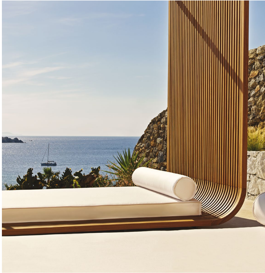
ΤΟΣΟ ΤΟ ΜΠΑΡ, ΟΣΟ ΚΑΙ ΤΑ ΚΡΕΒΑΤΙΑ ΠΟΥ ΒΡΙΣΚΟΝΤΑΙ ΓΥΡΩ ΑΠΟ ΤΗΝ ΠΙΣΙΝΑ, ΑΠΟΤΕΛΟΥΝ CUSTOM MADE ΚΑΤΑΣΚΕΥΕΣ, ΟΙ ΟΠΟΙΕΣ ΑΝΑΔΕΙΚΝΥΟΥΝ ΤΗΝ ΑΠΛΟΤΗΤΑ ΤΟΥ ΧΩΡΟΥ ΚΑΙ ΤΗΝ ΑΠΡΟΣΚΟΠΤΗ ΘΕΑ ΠΡΟΣ ΤΗ ΘΑΛΑΣΣΑ.

Και στις δύο τυπολογίες, η επιλογή των υλικών αποτελεί μία άμεση αναφορά στην ευρεία χρήση του λευκού χρώματος στα νησιά των Κυκλάδων. Πατητό τσιμεντοκονίαμα σε αποχρώσεις του λευκού, φυσικό ξύλο και πέτρα αποτελούν τα κύρια υλικά, ενώ προσεκτικά επιλεγμένα στοιχεία σε χρυσό τόνο δίνουν μία νότα διακριτικής πολυτέλειας. Κάθε δωμάτιο διαθέτει ιδιωτική βεράντα, στην οποία βρίσκονται χώροι ανάπαυσης και ιδιωτική πισίνα. Η τυπολογία του κάθε δωματίου επεκτείνεται και στον εξωτερικό χώρο