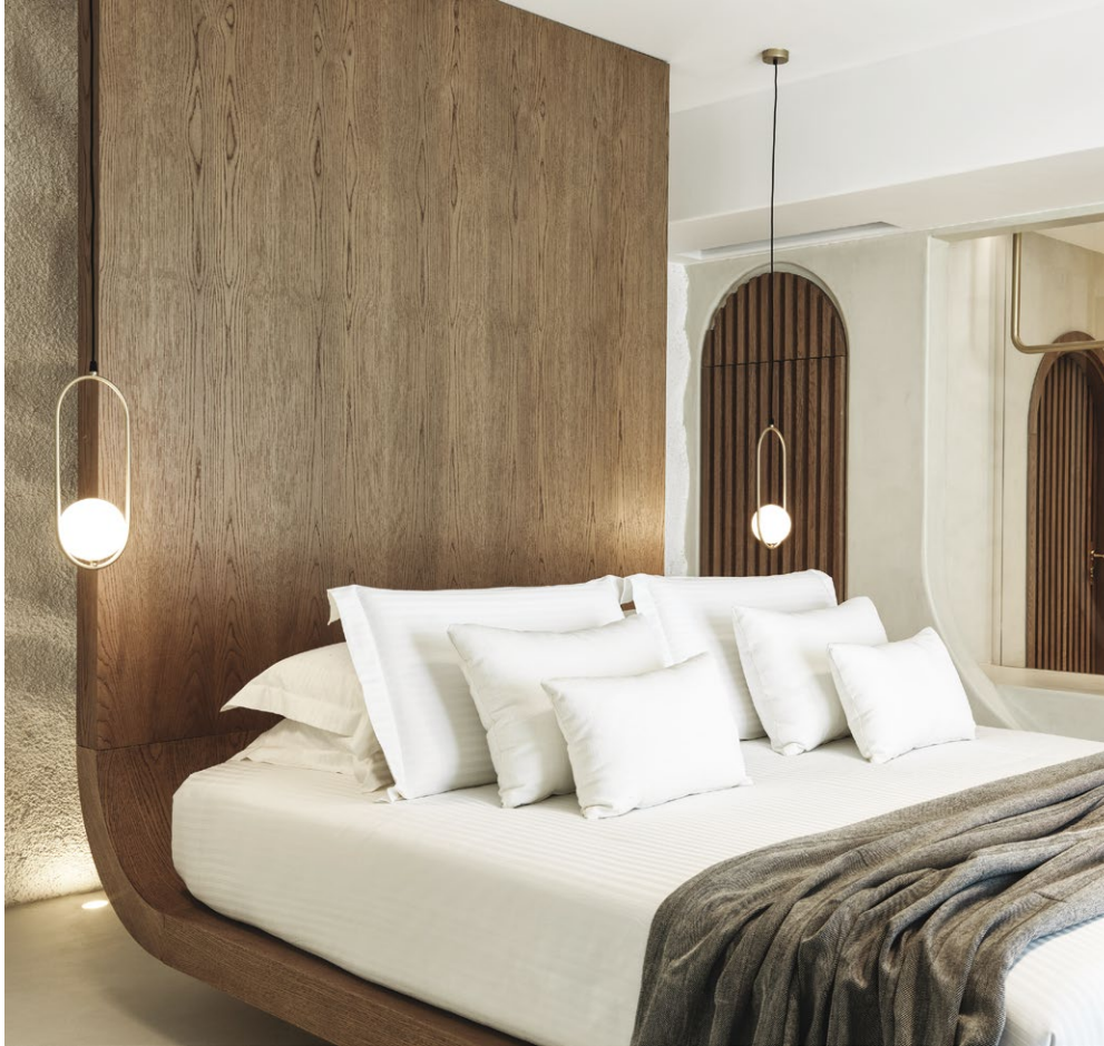
ΣΕ ΑΝΤΙΘΕΣΗ ΜΕ ΤΙΣ ΛΙΤΕΣ ΑΠΟΧΡΩΣΕΙΣ ΤΟΥ ΔΩΜΑΤΙΟΥ, ΤΑ ΚΡΕΒΑΤΙΑ ΑΚΟΛΟΥΘΟΥΝ ΜΙΑ ΠΙΟ ΑΥΣΤΗΡΗ ΣΧΕΔΙΑΣΤΙΚΗ ΠΡΟΣΕΓΓΙΣΗ, ΕΝΩ ΓΙΑ ΤΗΝ ΚΑΤΑΣΚΕΥΗ ΤΟΥΣ ΕΧΕΙ ΕΠΙΛΕΓΕΙ ΔΡΥΣ, ΩΣΤΕ ΝΑ ΥΠΟΓΡΑΜΜΙΖΕΤΑΙ Η ΓΕΩΜΕΤΡΙΑ ΤΟΥΣ.

του με τη χρήση όμοιων υλικών και τεχνοτροπιών στις ξύλινες custom-made κατασκευές. Μ' αυτόν τον τρόπο, επιτυγχάνεται η οπτική συνάφεια του εσωτερικού με τον εξωτερικό χώρο, ενώ η τοποθέτηση της πιάνας προς την πλευρά της θάλασσας υπογραμμίζει την εγγύτητα στο υγρό στοιχείο και την προνομιακή θέα.