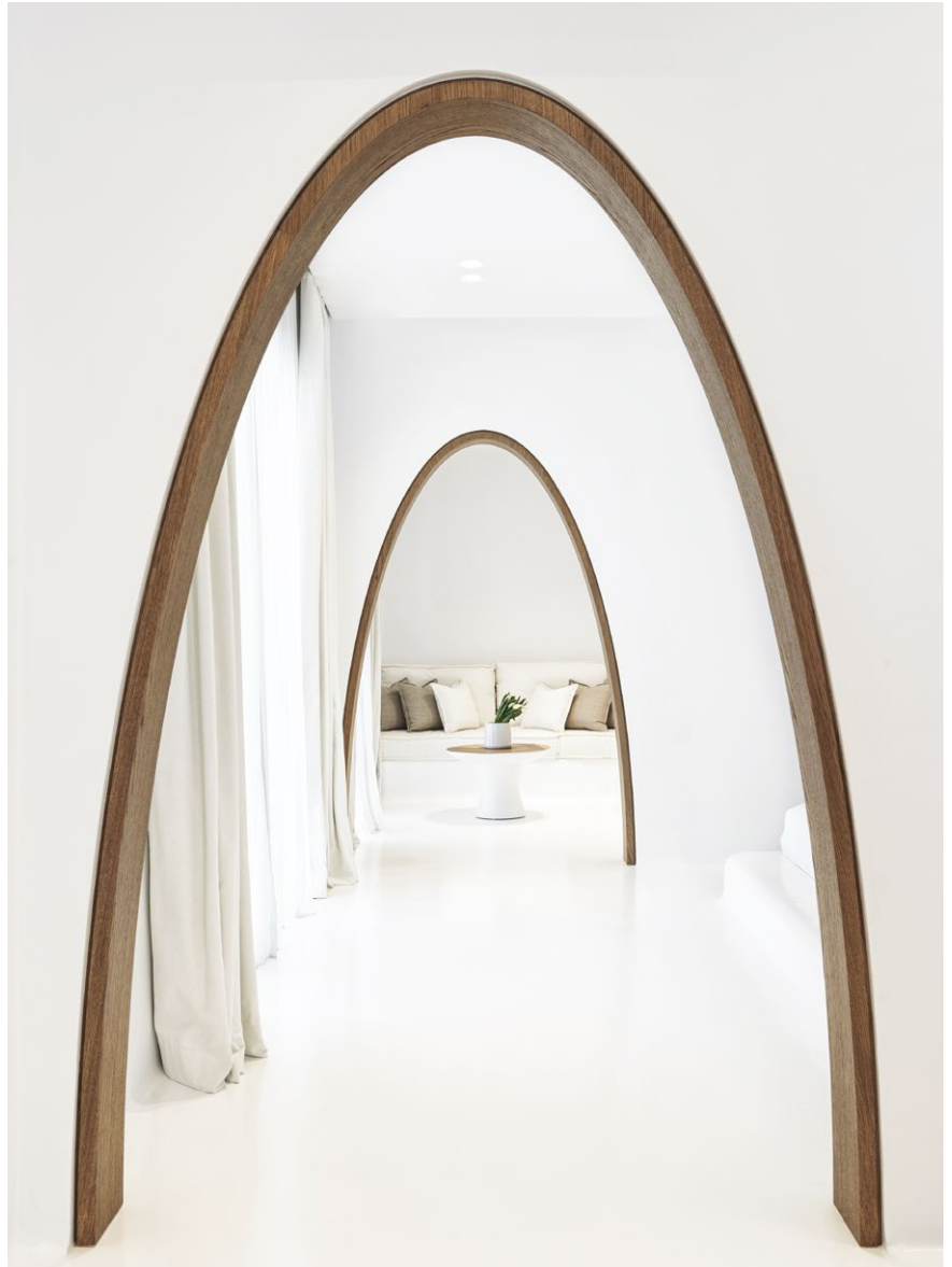
ΣΤΑ ΔΩΜΑΤΙΑ ΔΗΜΙΟΥΡΓΟΥΝΤΑΙ ΑΨΙΔΕΣ ΣΕ ΟΛΑ ΤΑ ΠΕΡΑΣΜΑΤΑ ΠΟΥ ΠΑΡΑΠΕΜΠΟΥΝ ΣΤΗΝ ΠΑΡΑΔΟΣΙΑΚΗ ΑΡΧΙΤΕΚΤΟΝΙΚΗ ΤΩΝ ΚΥΚΛΑΔΩΝ.

Το έργο "Mykonos Earth Suites" boutique hotel βρίσκεται στην περιοχή Μεγάλη Άμμος της Μυκόνου. Η έμπνευση πίσω από τη σχεδιαστική προσέγγιση των εσωτερικών χώρων προήλθε από δύο κύρια στοιχεία της παραδοσιακής κυκλαδίτικης αρχιτεκτονικής. Οι αψίδες κατέχουν δεσπόζουσα θέση στο αρχιτεκτονικό λεξιλόγιο των Κυκλάδων. Ενώ αρχικά αποτελούσαν ένα αναγκαίο άκαμπτο δομικό στοιχείο, η ευρεία εφαρμογή τους τις έχει αναγάγει σε αναπόσπαστο αισθητικό στοιχείο της αιγαιοπελαγίτικης αρχιτεκτονικής.