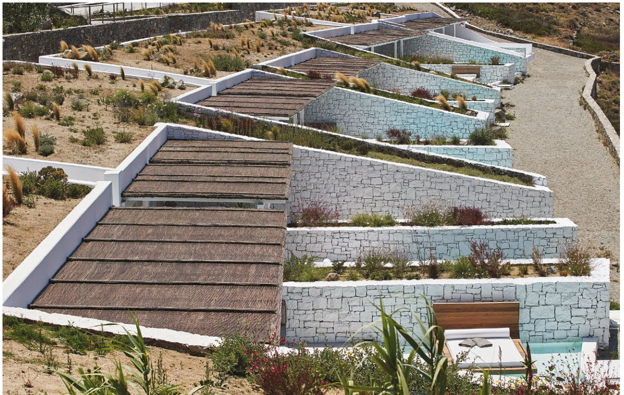
ΟΙ ΣΟΥΙΤΕΣ ΕΝΑΡΜΟΝΙΖΟΝΤΑΙ ΠΛΗΡΩΣ ΜΕ ΤΟ ΦΥΣΙΚΟ ΑΝΑΓΛΥΦΟ ΤΟΥ ΕΔΑΦΟΥΣ ΚΑΙ ΤΗΝ ΤΟΠΙΚΗ ΑΡΧΙΤΕΚΤΟΝΙΚΗ.